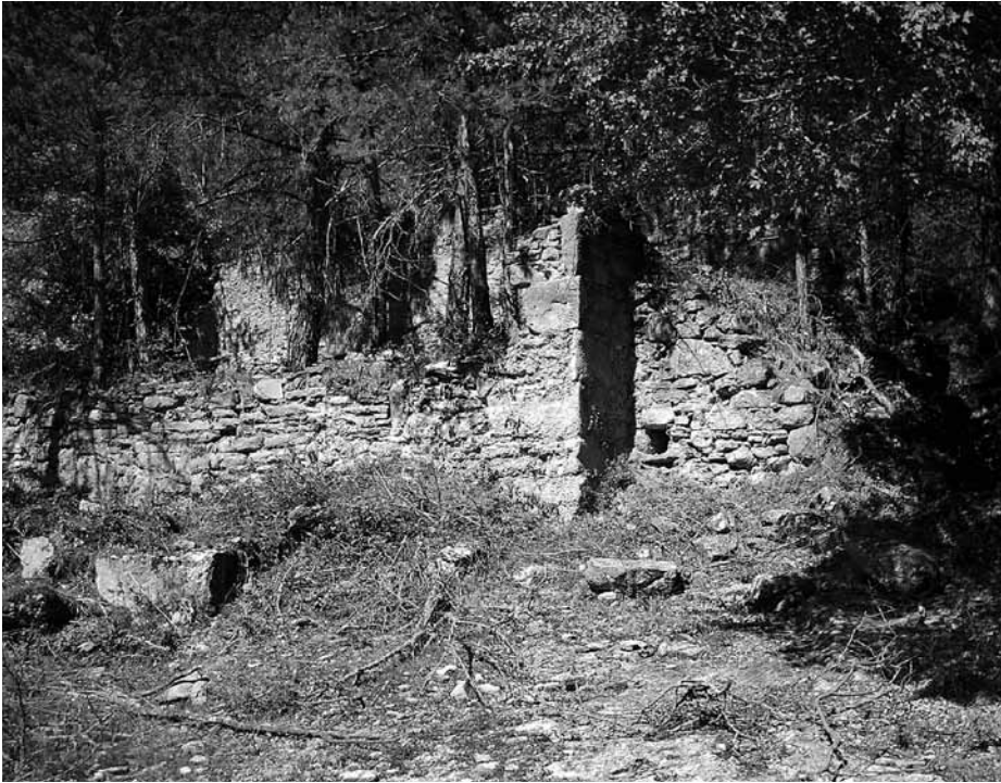
La masia dita del Cel-Purgatori-Infern, a les Llosses.

Pel que fa a la masia Cel-Purgatori-Infern, de Santa Maria de les Llosses, cal dir que no se n'ha trobat cap referència en els padrons anteriors a 1930 que es conserven a l'arxiu municipal d'aquest poble. D'aquesta manera, la referència més antiga que se'n té és de 1965 (vegeu la nota 704). Actualment apareix en els mapes de l'Institut Cartogràfic de Catalunya (escales 1:10.000 i 1:5.000) i està inclosa en el catàleg de masies del municipi (arxiu municipal). Tampoc no s'ha trobat cap referència a la masia del Purgatori de Tagamanent en els censos i padrons que es conserven en aquest arxiu municipal, el més antic dels quals és de 1898.