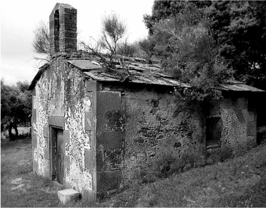
Sant Isidre de la Figuera, Tagamanent.

2006; 874). A Sant Fruitós de Balenyà, en una visita del 2 de setembre de 1759 es parla de les capelles de sant Isidre i del Salvador, « nuebamente fabricadas », a les quals es dedica el producte d'una caritat que es feia el dia dels difunts. 582