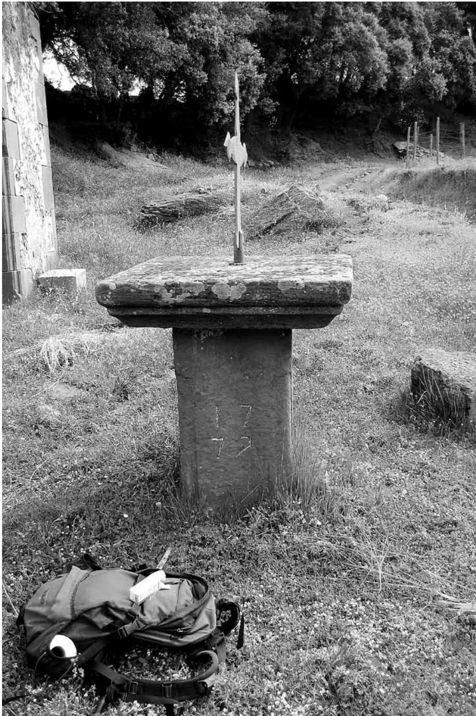
Pedró de Sant Isidre de la Figuera.