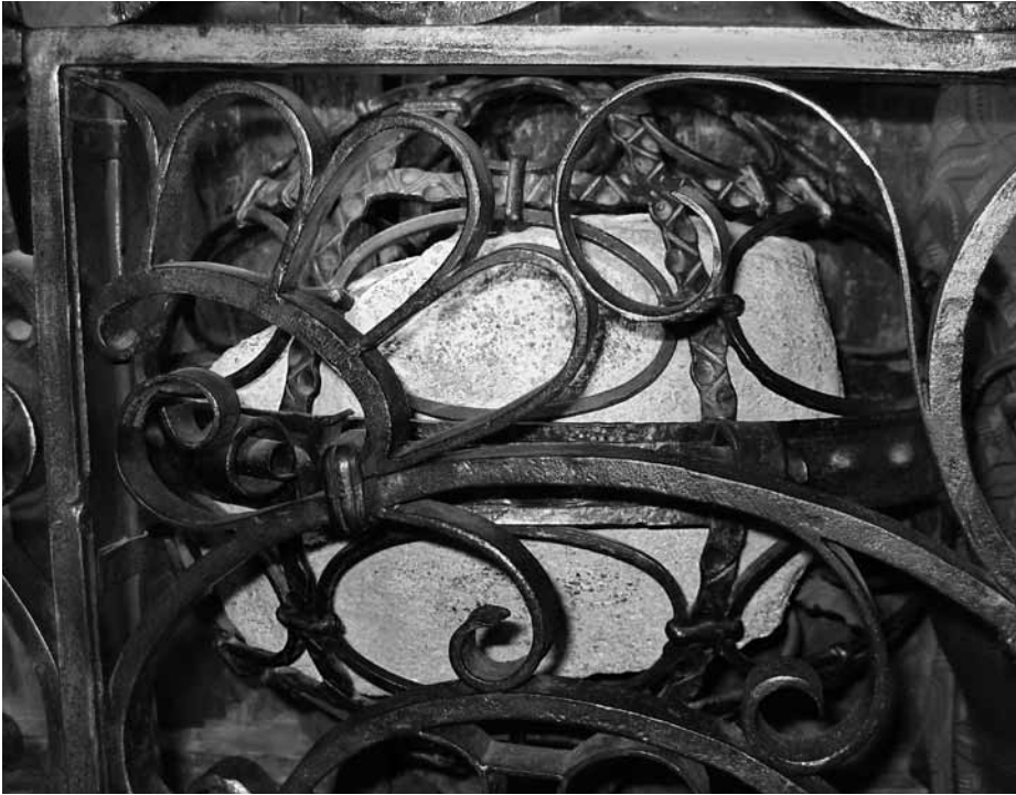
Pedra sobre la qual dormia sant Miquel dels Sants que es conserva a l'oratori de la seva casa natal a la ciutat de Vic.