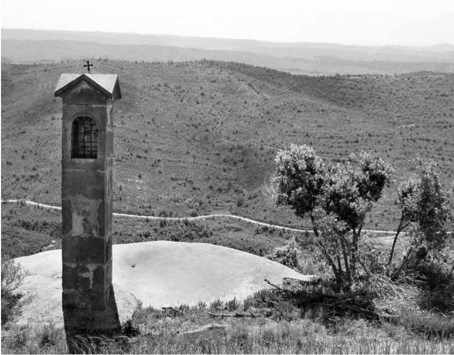
Oratori dedicat a sant Celdoni i sant Ermenter (Cellers). A la dreta es veu el forat que seria la petjada del seu cavall.

del cingle serien les petjades del cavall dels sants que van saltar d'una muntanya a l'altra mentre escapaven d'una persecució dels sarraïns. Cal remarcar que en alguns casos hem sentit atribuir aquesta petjada a sant Jaume i que el document que s'esmenta més avall posa els jueus com a perseguïdors. Mirant cap a llevant, just a sobre la carena de l'altra banda de la vall (deixant el monestir de Cellers enmig) hi ha un altre pedró de característiques força semblants, que se suposa que indicaria el lloc on va acabar el salt del cavall dels màrtirs (Coberó, 1982). Sobre aquesta petjada, l'any 1594 Salvador Pons escrivia: