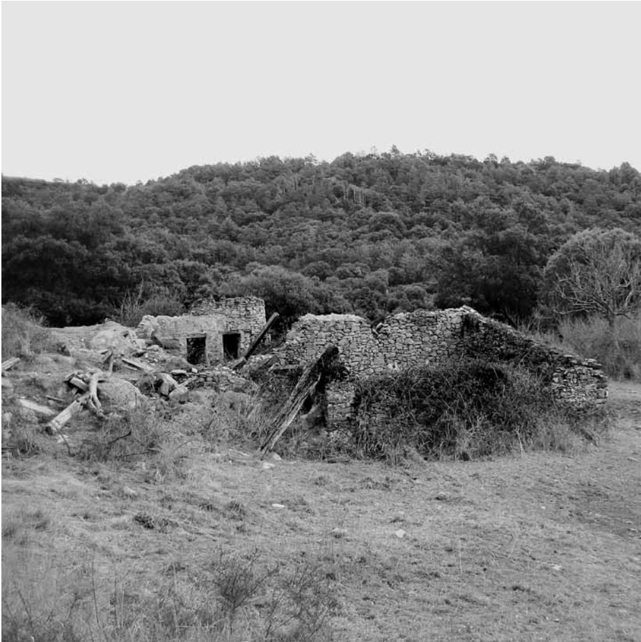
Runes de Casanova de Dalt, l'amo de la qual va tenir un important conflicte per l'ús dels boscos al segle XVIII.