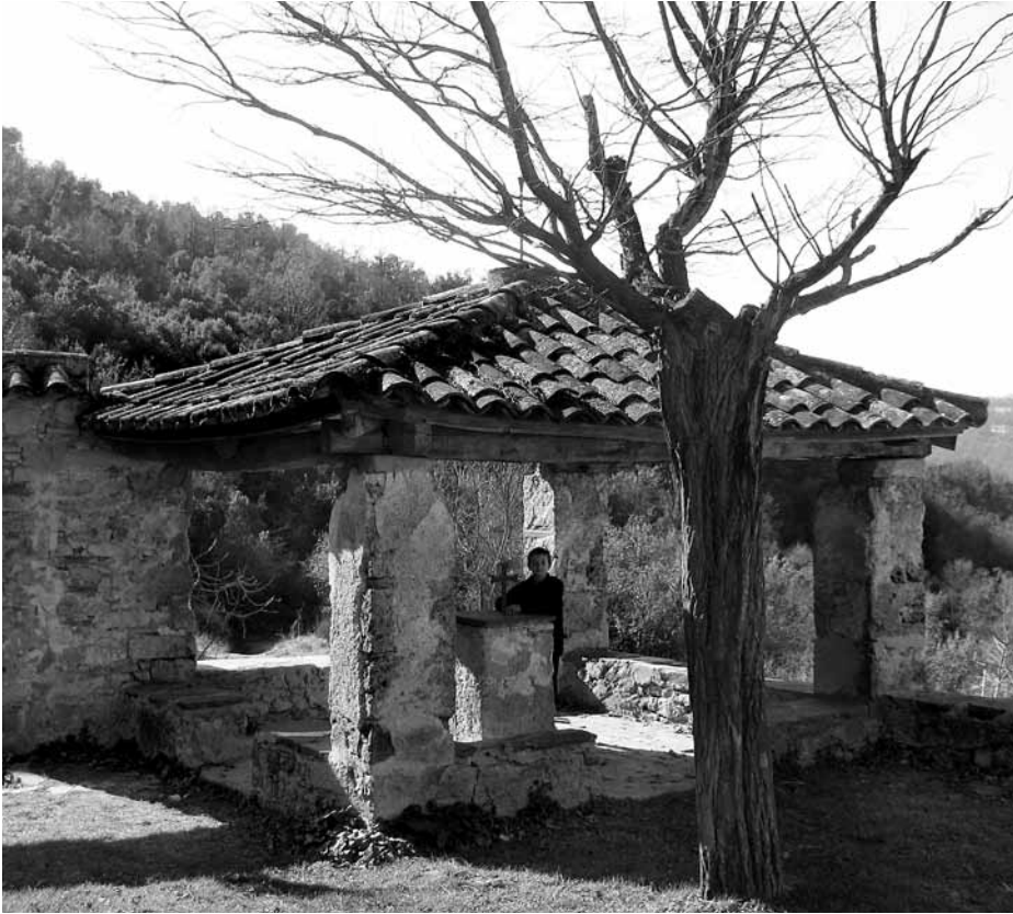
Comunidor de Sant Martí del Congost (Aiguafreda de Dalt).

«(...) si no fos estat per lo comunir lo temps los capellans lo tocar les campanes, que si no fos per axó apenes dexarien les bruixes res per terra.» (Ginebra, 2007; 88)