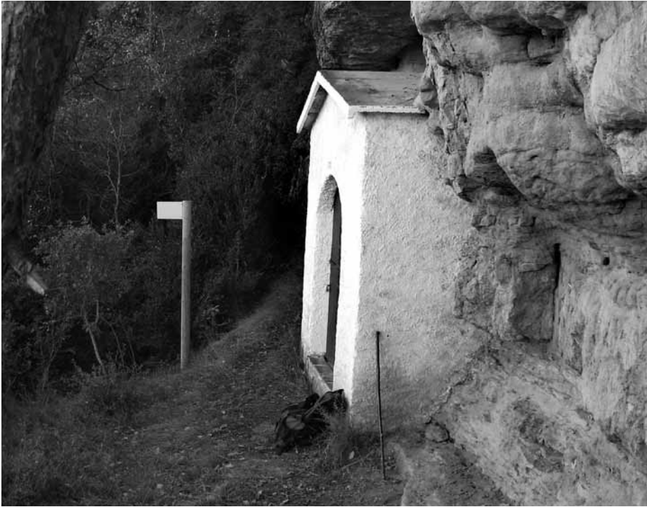
Cova dels Sants Màrtirs, a Quintanes.