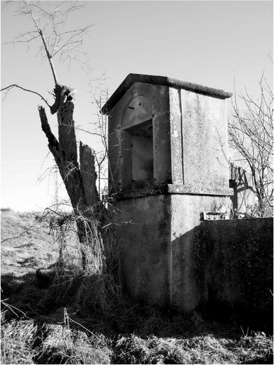
Oratori de Sant Miquel dels Sants al mas Mitjà.