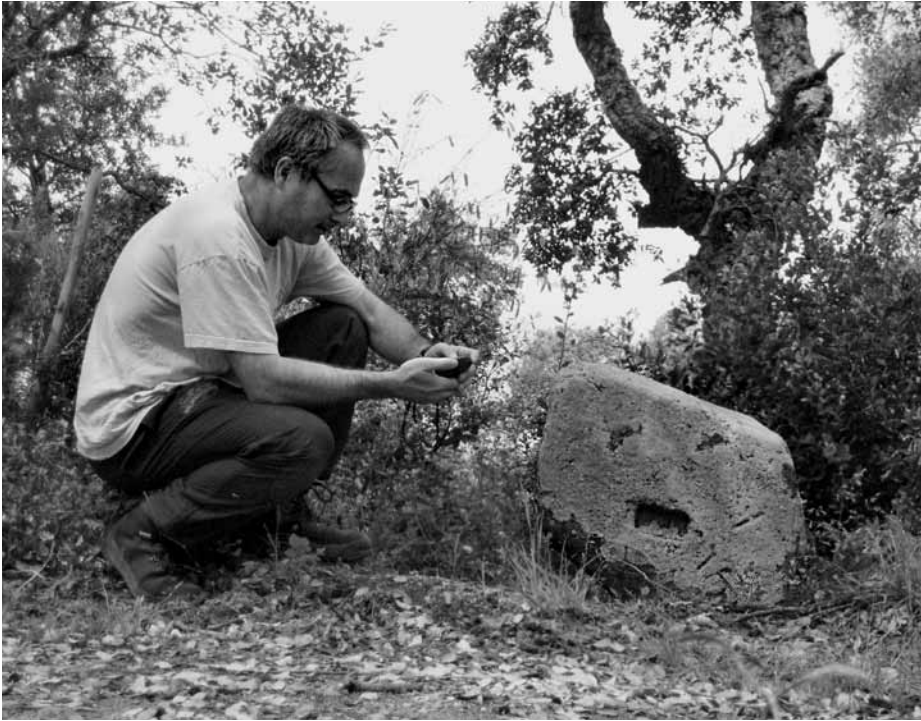
L'autor del llibre al costat de la pedra que conté la Petja de Sant Salvi.

L'any 1890 apareix la primera referència que coneixem a la Petja de Sant Salvi, al límit municipal entre Arbúcies i Sant Feliu de Buixalleu. 731 Segons l'obra Las Guillerías , publicada per Julio Serra el 1891, es tracta de