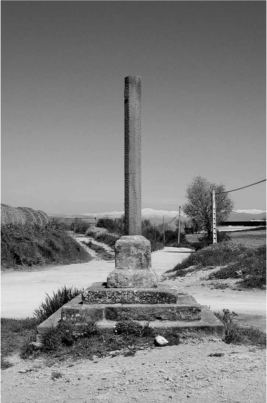
Peu de Mitja Via, on les processons vigatanes que anaven a la Gleva feien una aturada.