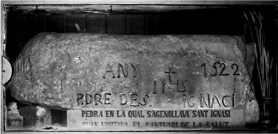
Pedra sobre la qual s'agenollava sant Ignasi de Loiola al santuari de la Salut de Viladordis (Bages).

Lucas de 1633 es parlava de miracles relacionats amb el foc i el mar, però no amb altres elements rurals. 556 Però ja l'any 1645 una obra publicada a Madrid atribuïa a sant Ignasi un miracle relacionat amb la climatologia agrària i la protecció en contra d'alguns temporals marins; 557 anys més tard es deia que el cingol que havia deixat a Viladordis «(...) en tiempo de tempestades, que son allá muy frequentes, le sacan, y bendizen con él los campos», 558 i dues dècades més endavant s'hi afegia, «No hablando de las vezes que ha concedido lluvia para los sembrados à los Pueblos que se la pedian (...)». 559 La voluminosa obra de Francesc Xavier Fluvià, de 1753, també insistirà en el tema «(...) que muchas vezes ha concedido milagrosamente la lluvia para los sembrados, pidiendola los Pueblos, por su intercession (...)» 560 i posarà un parell d'exemples de fora del nostre país: