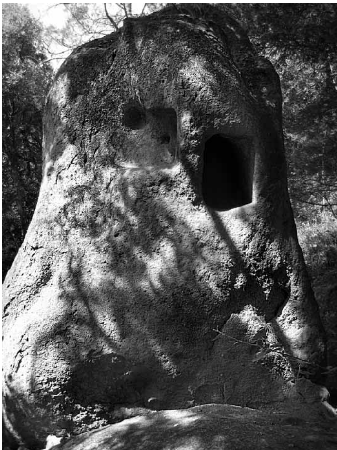
Roc de la Bruixa, Prats de Lluçanès.

de novembre de 1617 a les cinc de la tarda, el cel es va ennegrir i va començar a caure aigua, pedra, llamps i trons d'una manera «(...) que nunca los nacidos tal avian visto ». Van ser més de vint-i-quatre hores seguides de pluja que van fer créixer el riu Mèder fins al punt que passava per sobre del pont del carrer de Sant Francesc. A més a més, un gran arbre es va encallar al pont i va inundar els carrers de Sant Francesc i d'Esclafidors; més de cinquanta cases resultaren arruïnades (Junyent, 1977). Els habitants del carrer de Sant Francesc van haver de refugiar-se al convent de predicadors, on els donaren menjar i els escalfaren,