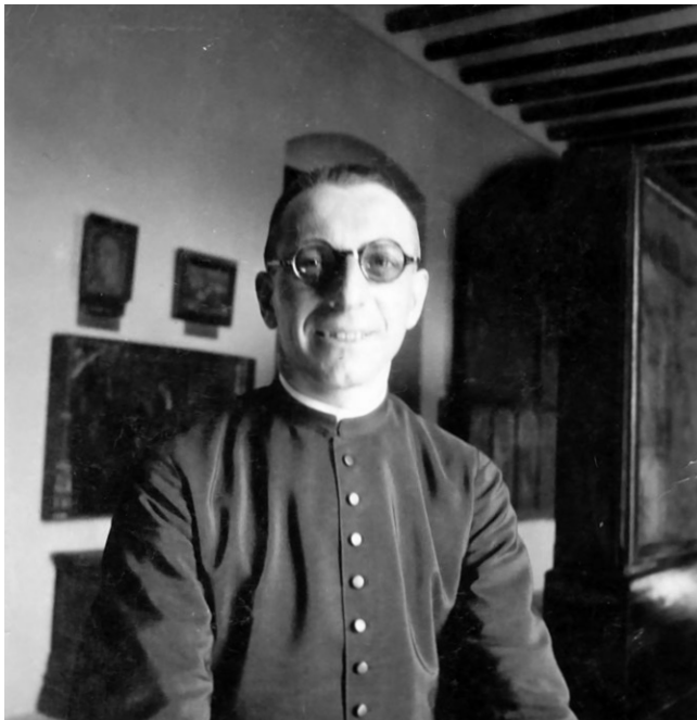
El Dr. Junyent al Museu Episcopal el 1934.

l'avinentesa d'un congrés eucarístic que se celebrava a Cartago. La Gazeta de Vich del dia 1 de maig de 1930 ho explicava als lectors: